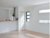
明るく開放的なリビングルーム。